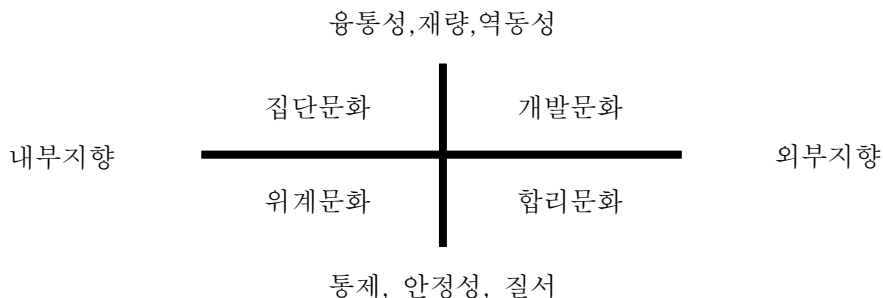
<그림 1> Kimberly와 Quinn의 조직문화유형

이 두 가지 기준에 의해 <그림 1>과 같이 장기적인 반응을 보이면서 인간중심적인 집단문화, 인간중심적인 업무방식을 지향하면서 적극적인 반응을 보이는 개발문화, 과업중심적이며 변화에 장기적인 반응을 보이는 위계문화, 과업중심적이며 적극적인 반응을 보이는 합리문화로 조직문화유형을 구분하고 있다(강홍구,2001)