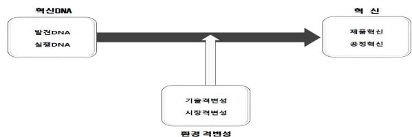
<그림 2> 연구 모형

혁신DNA는 Dyer et al(2011)이 제시한 발견DNA와 실행DNA로 구분하였다. 혁신은 제품혁신과 공정혁신으로 세분화하였다(Abernathy and Utterback, 1978; Birasnav et al., 2013). 환경 격변성은 기술격변성과 시장격변성으로 구분하였다(Moorman and Miner, 1997; Jaworski and Kohli, 1993). 적합성은 Muchinsky and Monahan(1987)에 의해 개념화된 상호적합성과 보완적합성에 바탕을 두어, 혁신DNA와 혁신 속성에서 상이한 두 속성 간에 특성을 반영하는 적합성 맥락에서 접근하고자 한다.